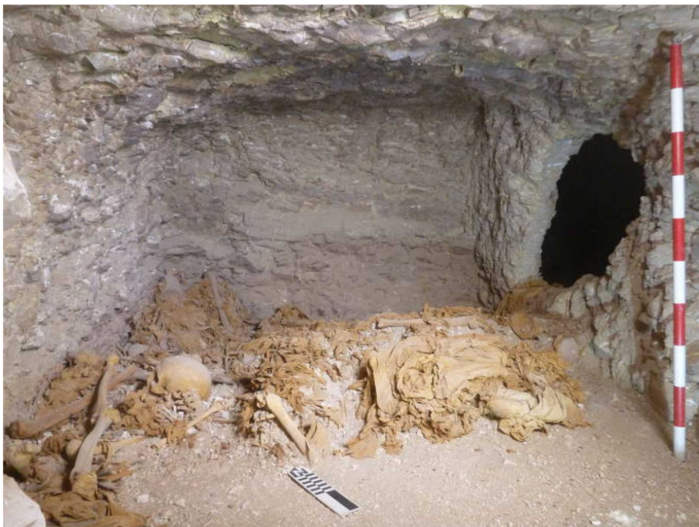
Excavación de Galería Horizontal